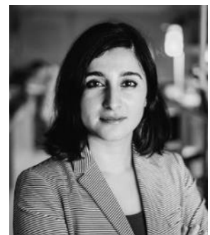
Dra. Lydia Bourouiba, directora de La Dinámica de Fluidos en la Transmisión de Enfermedades en MIT.

Steelcase trabajará con la Dra. Bourouiba para llevar a cabo pruebas de laboratorio combinadas y modelado de configuraciones y materiales de muebles para determinar las mejores combinaciones para reducir la propagación de enfermedades respiratorias. El trabajo se llevará a cabo a través de una serie de fases y los hallazgos beneficiarán inmediatamente a las organizaciones proporcionando mejores prácticas para ayudar a modernizar o reconfigurar los lugares de trabajo existentes.