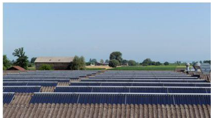
Colectores solares en la planta de Gaissau, Austria

La norma según ISO 50001 establece los requisitos que debe cumplir una organización para implementar, hacer realidad, conservar y mejorar un sistema de gestión energética. El objetivo principal de la norma es la continua mejora del rendimiento energético y la eficiencia energética, así como el ahorro de energía.