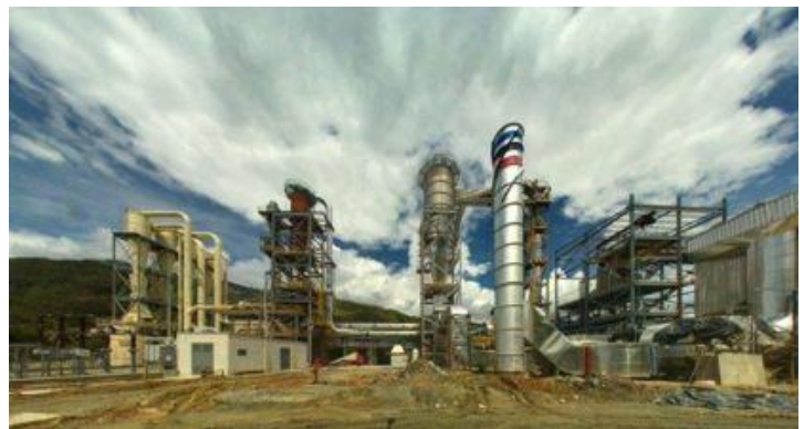
Planta de MDF de Tablemac en Barbosa, Colombia

El atractivo del mercado colombiano para Duratex está en función de la estabilidad político jurídica, el crecimiento económico, el déficit habitacional de 2 millones de unidades, el muy bajo consumo per cápita de tableros de madera y la entrada en producción de la primera planta de MDF en Colombia recientemente inaugurada por Tablemac.