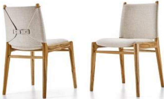
860HERVALCappio Chair_Designer Sérgio Batista_Uultis (Herval Furniture).jpg

Estados Unidos - Uultis, la marca internacional de muebles de alta gama propiedad del Grupo Herval de Brasil, abrió su primer almacén en los Estados Unidos, ubicado en Miami, Florida.