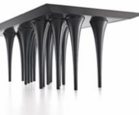
860HERVAL_Pin Dinner Table_Designer Sérgio Batista_Uultis (Herval Furniture).jpg