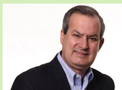
Antonio Joaquim de Oliveira, presidente de Duratex

BRASIL - Duratex, la mayor productora de paneles de madera industrializada y pisos, cerámica y metales sanitarios del Hemisferio Sur, anuncia la entrada en un nuevo segmento de actividad, el de celulosa soluble, en asociación con el grupo austriaco Lenzing, líder en la producción de fibras especiales de celulosa.