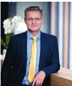
Tom K. Schäbinger, CEO Pfliederer Group

El EBITDA aumentó en 18.5% en el 1T-2018 a € 36.5 millones y el margen EBITDA aumentó a 13.6% en comparación con 12.2% en el 1T-2017. Este fuerte aumento se debe, entre otros factores, al desarrollo de las ventas de productos de valor agregado y una nueva política de precios, que mitigó el impacto de los