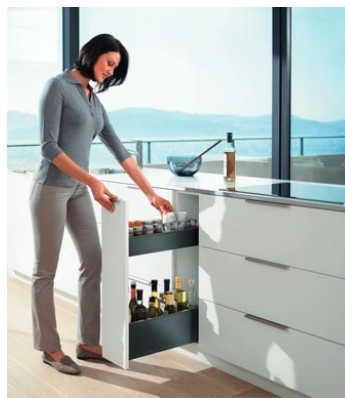
Los armarios angostos permiten utilizar pequeños nichos y son excelentes para guardar cosas de escaso ancho.

Cuando las superficies de la vivienda son pequeñas es bueno utilizar la altura lo mejor posible. Para este reto Blum propone una extracción de zócalo con pisadera que tiene una doble ventaja. Por un lado, aumenta la extensión de acceso a los niveles más altos del armario superior. Por el otro, el cajón debajo de la pisadera es un lugar más de almacenaje.