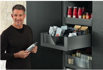
El ancho, la altura y la profundidad del armario despensa Space Tower es variable y puede adaptarse a cada situación de espacio.

ALEMANIA - En la Interzum 2017 de Colonia, Blum mostró soluciones para la óptima utilización del espacio disponible