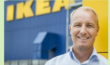
Peter Agnefjäll, CEO de Ikea Group.

SUECIA – En el año fiscal 2016, finalizado el 31 de agosto, las ventas del Grupo IKEA han ascendido a un total de EUR 34.200 millones (USD 37.600 millones), lo que supone un aumento del 7,1% ante el ejercicio anterior y un 4,8% en ventas tiendas comparables. "Este ha sido de nuevo un gran año para el Grupo IKEA, en el que hemos recibido 783 millones de visitas en nuestras tiendas. Queremos seguir ofreciendo a nuestros clientes productos de buena calidad y hogares inspiradores. El año pasado centramos la atención en la temática: 'Alrededor de la mesa', que cubre las áreas de cocinas, menaje y alimentación, y ha sido un gran éxito, muy apreciado por nuestros clientes", dijo Peter Agnefjäll, presidente y director general del Grupo IKEA. Ver más en Notifix.info