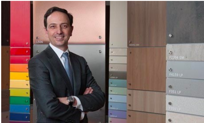
Rui Correa, CEO de Sonae Indústria.

PORTUGAL - Las ventas consolidadas de Sonae Industria alcanzaron 259 millones de euros en el primer trimestre de 2016, una mejora del 3,7% respecto al último trimestre y de un 0,4% en comparación con el mismo periodo de 2015.