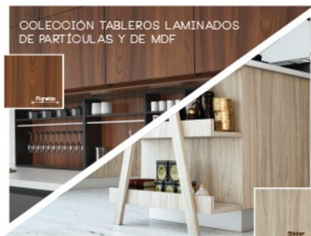
COLECCIÓN TABLEROS LAMINADOS DE PARTÍCULAS Y DE MDF