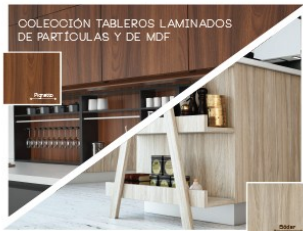
COLECCIÓN TABLEROS LAMINADOS DE PARTÍCULAS Y DE MDF