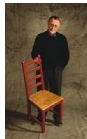
Ingvar Kamprad, fundador de IKEA

Al mismo tiempo, Ingvar Kamprad el fundador de la empresa de 87 años, ha decidido dejar la Junta. "Veo esto como un buen momento para dejar la Junta Directiva del Grupo Inter IKEA. Así estamos dando otro paso en el cambio generacional que ha estado en curso desde hace algunos años. Ver más en Notifix.info