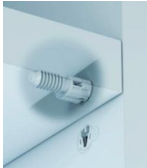
Italiana Ferramenta, uno de los ganadores del "Best of the Best".

ALEMANIA (Notifix).- El concurso, organizado por la Feria de Colonia, en cooperación con el red dot, recibió un total de 200 entradas de 16 países en esta versión 2013. Había tres categorías diferentes en las que los productos podrían ser presentados: materiales y superficies, herrajes, vidrio e iluminación, y fabricación de tapicería y ropa de cama.